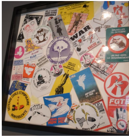
Foto's uit tentoonstelling "Give Peace a Change, Gent mei – juni 2018, georganiseerd door www.vrede.be